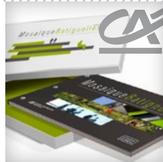
CRÉDIT AGRICOLE IMMO