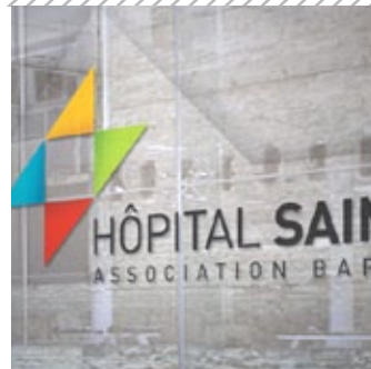
HÔPITAL SAINT JEAN