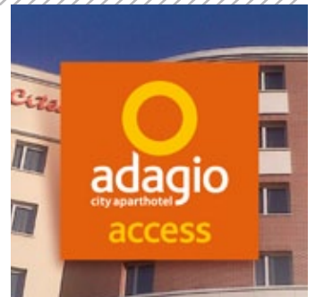
GRUPE ACCOR / ADAGIO